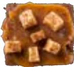
BROWNIE FUDGE ZEEZOUT Butterscotch karamel - vanillefudge 4.00