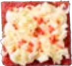
BLONDIE RED VELVET Zoete roomkaas - witte chocoladekrullen 4.00