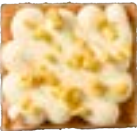
BLONDIE MANGO Mangocrème - mangocrunch 4.00