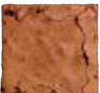
NATUREL Brownie of blondie Altijd lekker! 3.70