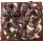
BROWNIE OREO Witte chocolade - Oreo-crumble 4.00