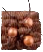
BROWNIE CHOCOLOCO Chocolademousse - koperen chocoparels 4.00